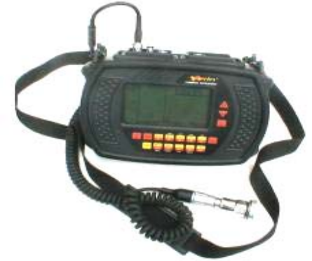
Trilling data collector & analyse